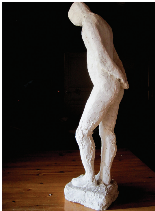
"Plasebo, lumelääke, se panee miettimään." Aleksi Joensuun kipsipatsas vuodelta 1988.

Masennuslääketutkimuksessa 65% potilaista sai apua