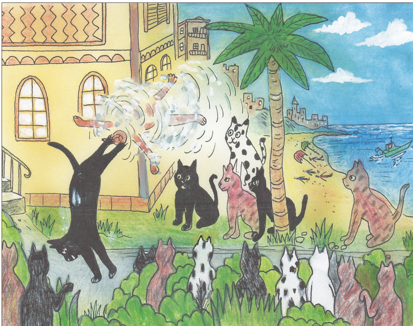
Kamppailulajissa eivät selitykset aina paina. Bagheera löyttää Shere Khania Teneriffan kissoissa.