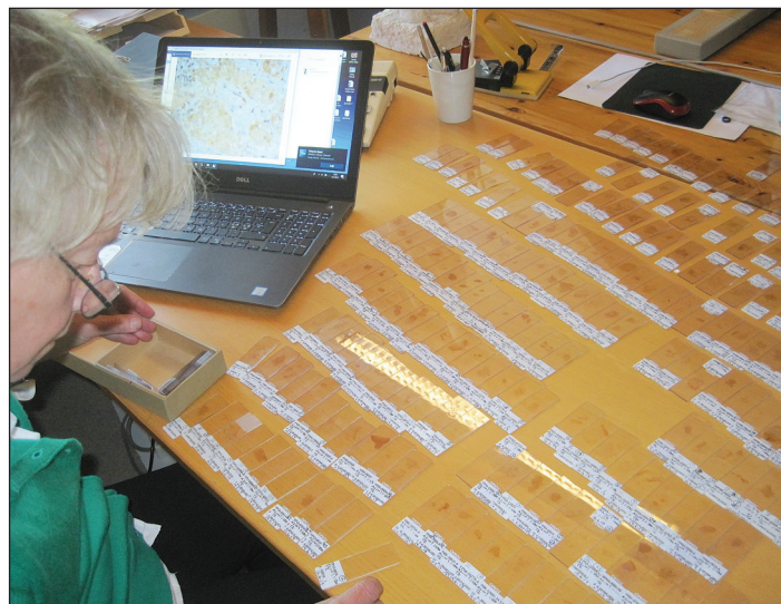
Tutkimustyö näyttää kuivakkaalta, mutta sitä se ei ole.