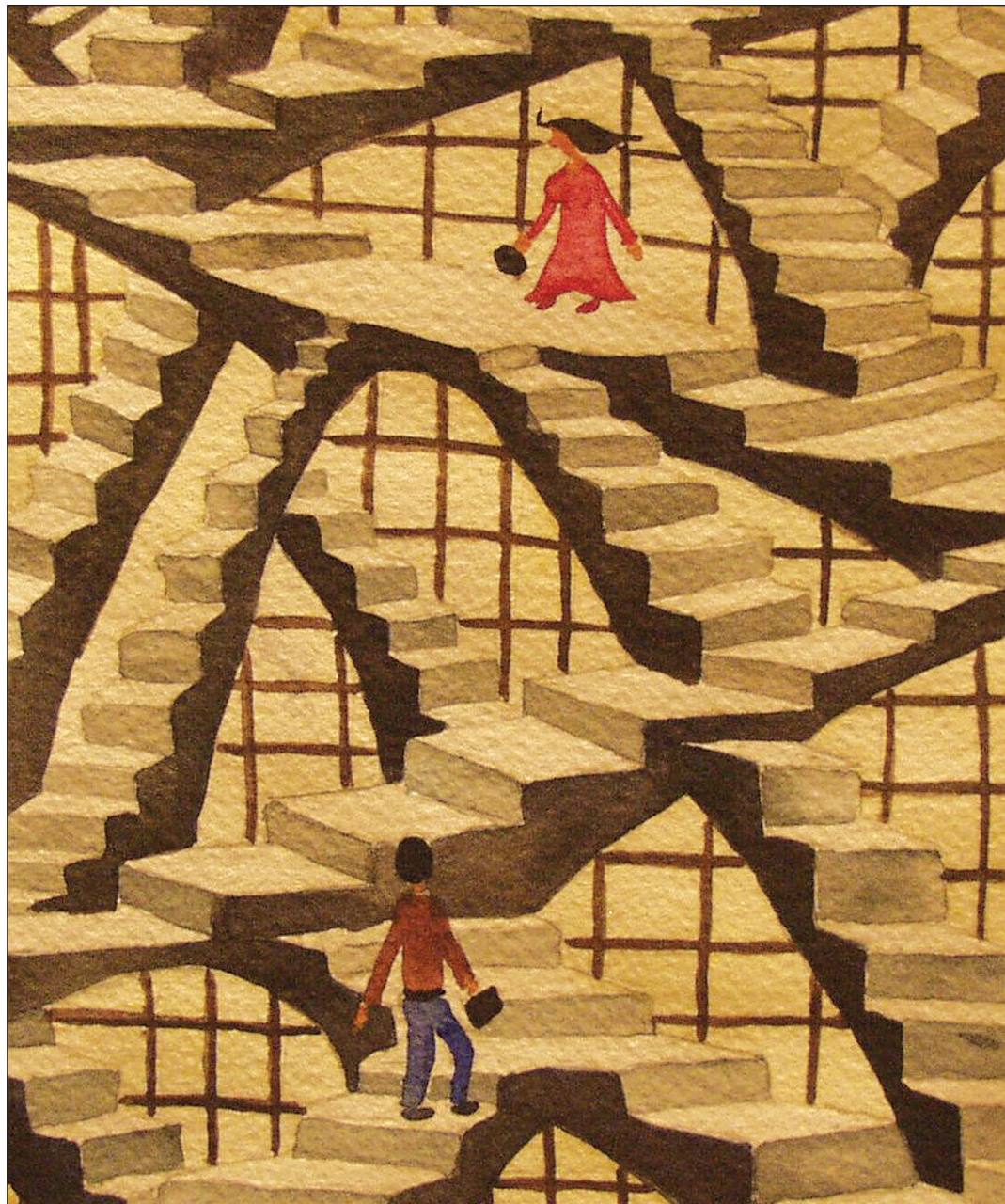
Totuuden tavoittaminen ei ole suoraviivaisen tien kulkemista. Aleksis Joensuu akvarelli Portaat

Uskomushoitajien kannattajat väittävät, että niihin asennoidutaan tieteessä enakkoluuloisesti torjuen.